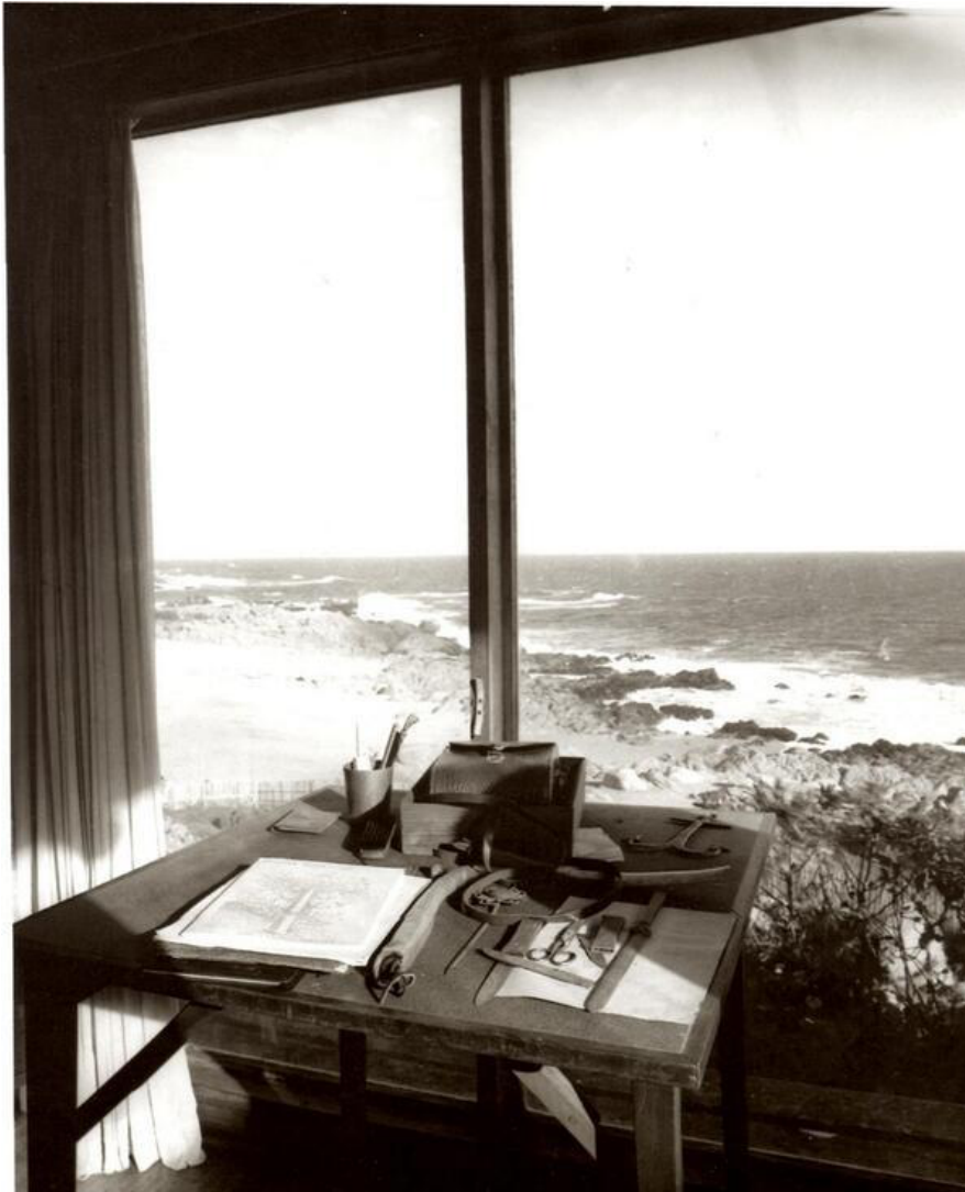
la table dans l'atelier de Dylan Thomas